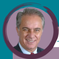
MARCOS MONTES (PSD/MG)

Secretário-executivo do Ministério desde 2019. É produtor rural, graduado em medicina pela UFU. Foi prefeito de Uberaba e deputado federal por três mandatos (2007-2019). Na Câmara, presidiu a Comissão de Agricultura, Pecuária, Abastecimento e Desenvolvimento Rural e foi presidente da Frente Parlamentar da Agropecuária