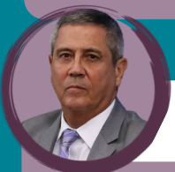
BRAGA NETTO (PL/MG)

Assume como assessor especial do Gabinete da Presidência da República. Possível candidato a vice-presidente na chapa com Jair Bolsonaro