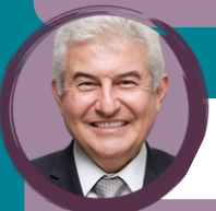
MARCOS PONTES (PL/SP)

Pré-candidata a senadora pelo Mato Grosso do Sul